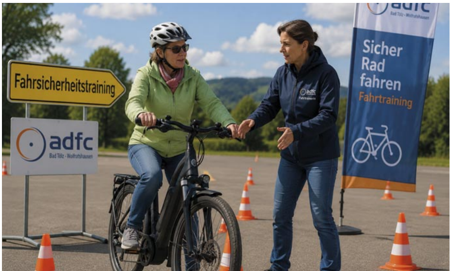
ADFC © privat BS

Der ADFC Kreisverband Bad Tölz-Wolfratshausen bietet daher unter dem Motto "Radspaß durch Fahrsicherheitstraining" Kurse gerade für Umsteiger auf Pedelecs an. Eine Studie des ADFC München hat gezeigt, dass sich die Kursabsolventen nach dem Kurs „sicherer“ oder sogar "viel sicherer" beim Radfahren fühlen (83 Prozent der befragten 99 Teilnehmer).