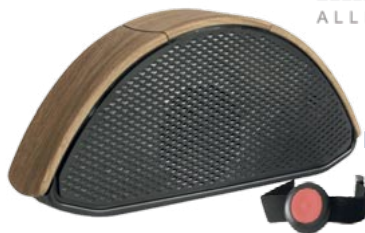
Hausnotrufgerät im Wohndesign